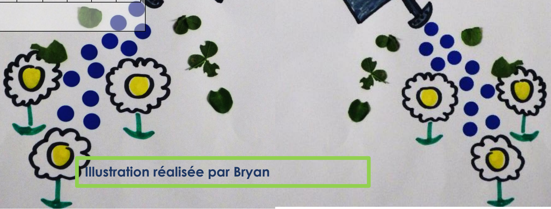
Illustration réalisée par Bryan