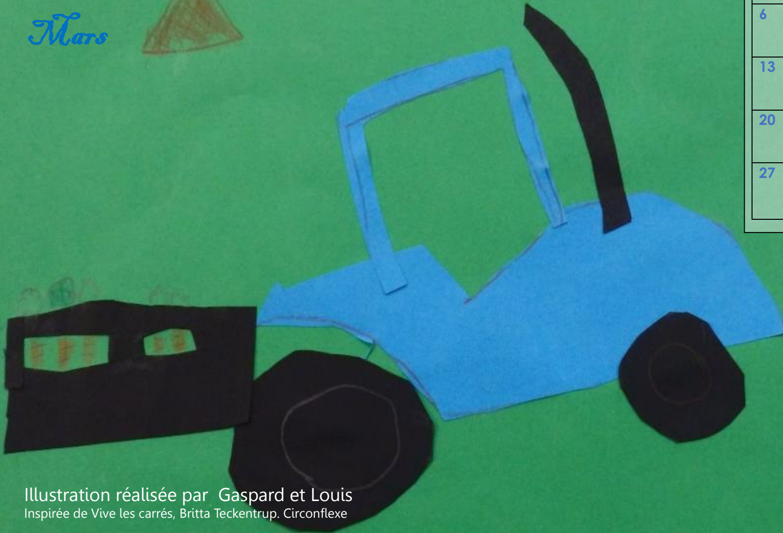
Illustration réalisée par Gaspard et Louis Inspirée de Vive les carrés, Britta Teckentrup. Circonflexe