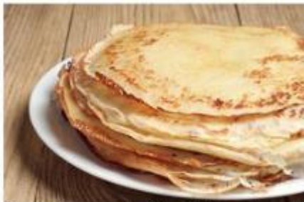
Nos crêpes sont prêtes, il n'y a plus qu'à tartiner !