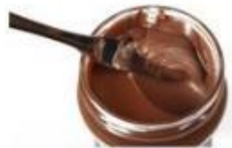
Pâte à tartiner