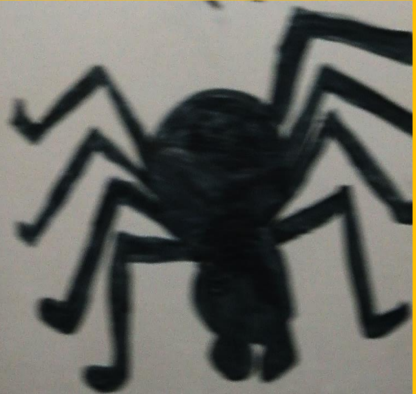
Illustration réalisée par Alex et Mat Inspirée de Etrange promenade