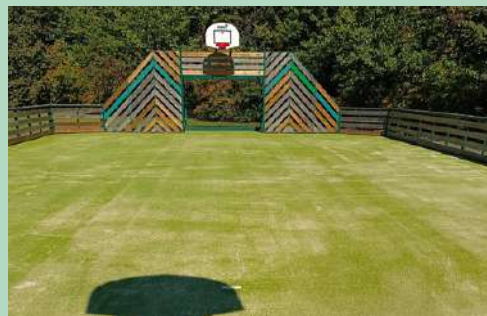
Remise en peinture et réfection des terrains de football et du City-stade

Pose de nouvelles fenêtres plus isolantes à l'école