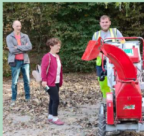
Broyage des déchets verts proposé par la MEL