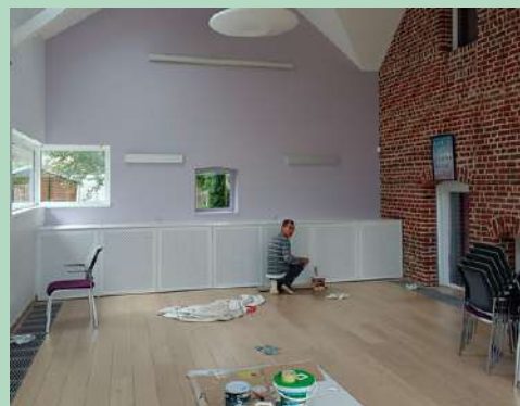
Remise en peinture de l'Espace Kalimera et de la salle du Conseil municipal